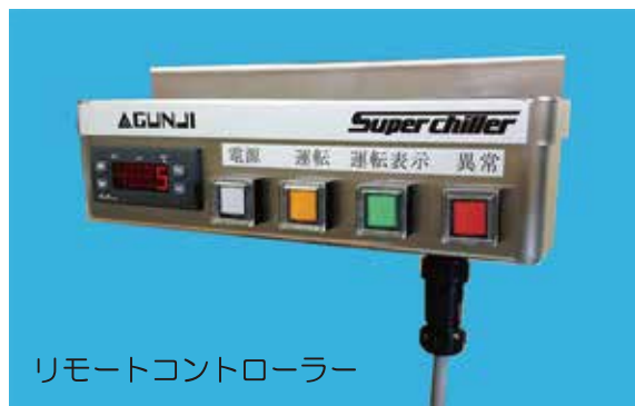
リモートコントローラー